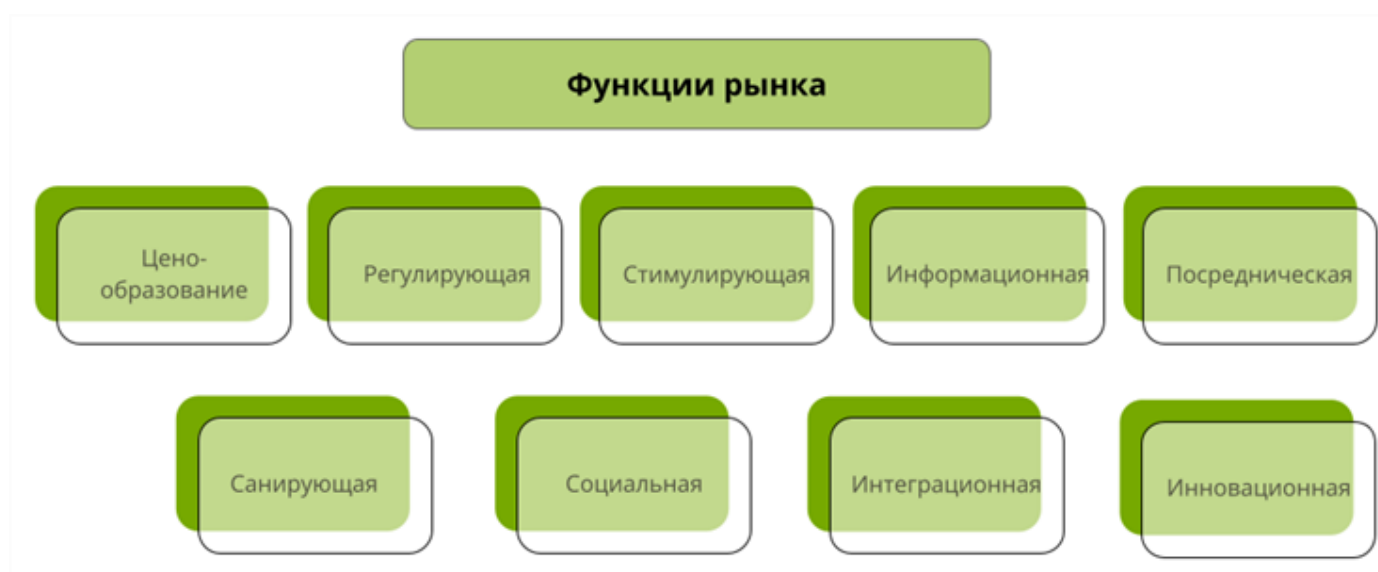
Рис. 1. Функции рынка

Рынок обеспечивает установление равновесной цены , при которой участники готовы заключать сделки. Рынок немедленно реагирует на любые изменения и подстраивает цену под них.